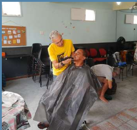
Eixo 1 LEVANTE

A fim de cumprir a nossa missão, oferecemos atividades que dialogam com os eixos de atuação. Elas vão desde cuidados básicos de higiene pessoal, até oficinas e eventos de arte e cultura, além de capacitações e as confecções de currículos com direcionamento para o mercado de trabalho.