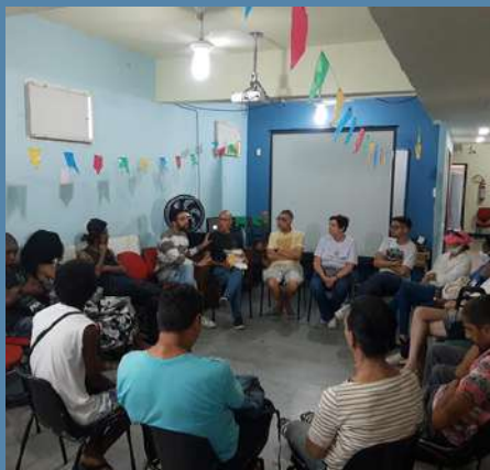
Eixo 2 ANDE