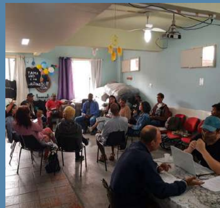
Eixo 3 RECOMECE